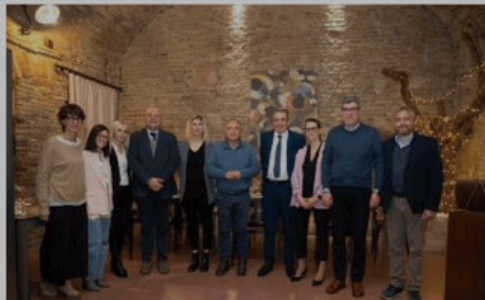
Il procuratore di Catanzaro Nicola Gratteri

Corinaldo blindata per la visita del Procuratore di Catanzaro Nicola Gratteri. E' arrivato ieri mattina nel borgo goretiano per una lezione di Educazione Civica che in pochi dimenticheranno. Il dottor Gratteri ha parlato agli studenti in occasione del convegno di Medicina Legale organizzato a Corinaldo. Impegnato in prima linea contro la 'ndrangheta, vive sotto scorta dall'aprile del 1989, dopo che la sua prima indagine aveva provocato le dimissioni dell'assessore alla Forestazione e fatto cadere la Giunta regionale calabrese. Un anno fa al Procuratore era stata concessa una scorta rafforzata dopo che i clan della 'ndrangheta calabrese avevano manifestato l'intenzione di «farlo saltare in aria». Per garantire la sicurezza è stato chiuso il centro storico e appostati numerosi divieti di sosta, inoltre, la sua presenza non era stata pubbli-