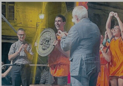
La consegna del sacro vassoio